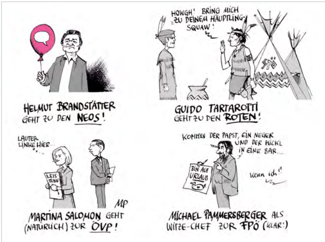
... und schon gibt's Gerüchte!