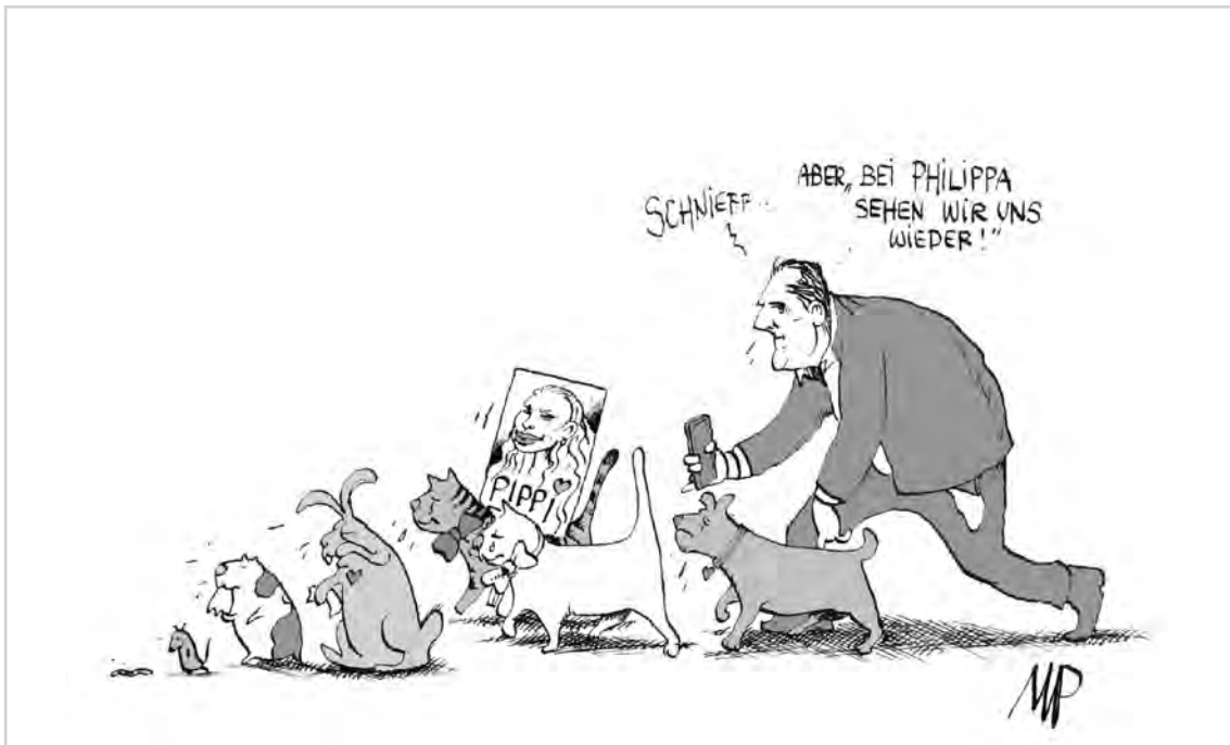
Mah, die armen Tiere: Frauli kommt doch nicht ins Parlaementi ...