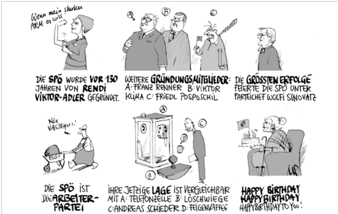
130 Jahre SPÖ: lernen Sie Geschichte!