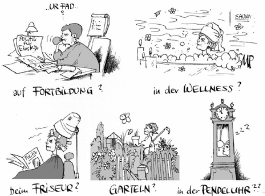
Wo ist eigentlich die SPÖ-Vorsitzende?