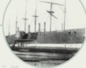
S. 38 SS Great Eastern