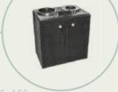
S. 150 Tonbandgerät Model 200A von Ampex