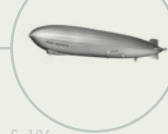
S. 126 LZ 127 Graf Zeppelin