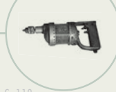
S. 118 Bohrmaschine von Black & Decker