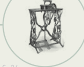
S. 36 Singers «Schildkrötenrücken»