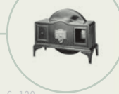
S. 130 Bairds «Televisor»