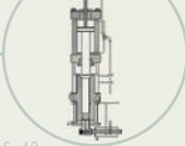
S. 42 Hyatts Spritzgießmaschine