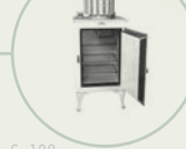
S. 122 «Monitor Top»-Kühlschrank