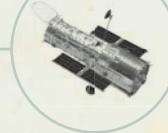
S. 210 Hubble-Weltraumteleskop