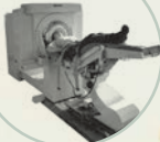
S. 180 CT-Scanner von Emi