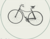
S. 54 Sicherheitsfahrrad «Rover»