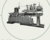
S. 52 Parsons' Dampfturbine