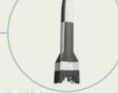
S. 142 V2-Rakete von Mittelwerk