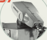
S. 170 Unimate 1900