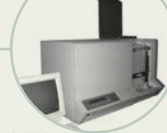
S. 208 DNA-Sequenzierer 370A von ABI