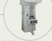
S. 138 Elektronenmikroskop von Siemens