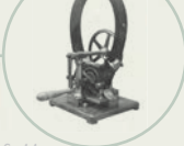
S. 44 Grammescher Ring