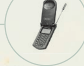
S. 214 Motorola StarTAC