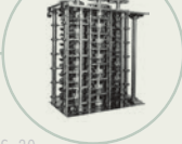
S. 30 Babbages Differenzmaschine