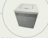
S. 146 Toplader-Waschvollautomat