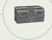
S. 136 Philco-York-Klimaanlage «Cool-Wave»