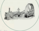
S. 26 Carliss-Dampfmaschine