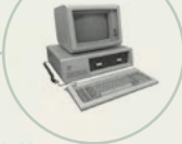
S. 200 IBM-PC 5150