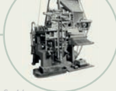
S. 46 Linotype