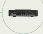
S. 206 Smartmodem 300 von Hayes