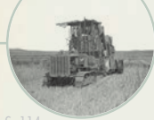
S. 114 Mährescher von Holt Caterpillar